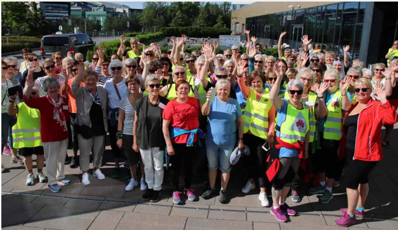
Det er sammen med andre at vi er best. Derfor er felles arenaer viktig for Sanitetskvinnene – de frivillige er organisasjonens viktigste ressurs.

Norske Kvinners Sanitetsforening (N.K.S.) ble stiftet 26. februar i 1896. En landsdekkende medlemsorganisasjon, som med sine 620 foreninger, er godt forankret i sine nærmiljøer.