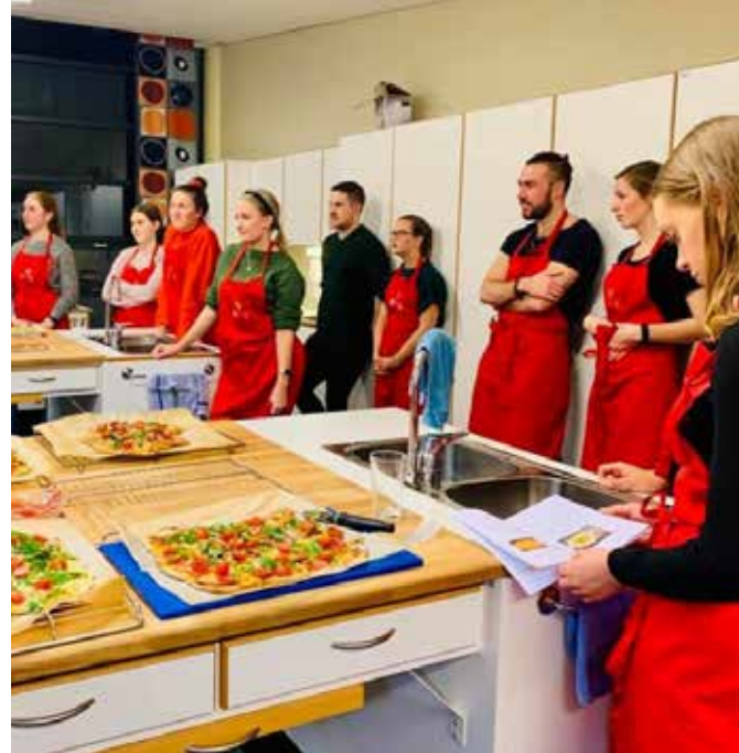
Gode vaner bør etableres tidlig. I prosjektet Dig In lærer unge å lage smart mat – sunt, godt og rimelig.

foreningenes tilbud om språktrening for innvandrerkvinner. I desember 2019 fikk vi tildelt midler fra Stiftelsen Dam for å utvide tilbudet om flerkulturell doula til Bergen, Stavanger og Kristinasand. Det jobbes også for å sikre en bærekraftig finansiering.