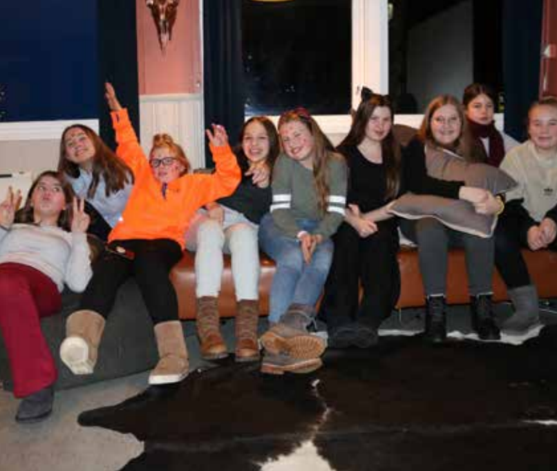
Det går livlig for seg når jentene møtes i Sisterhood-gruppa til Østensjø sanitetsforening.