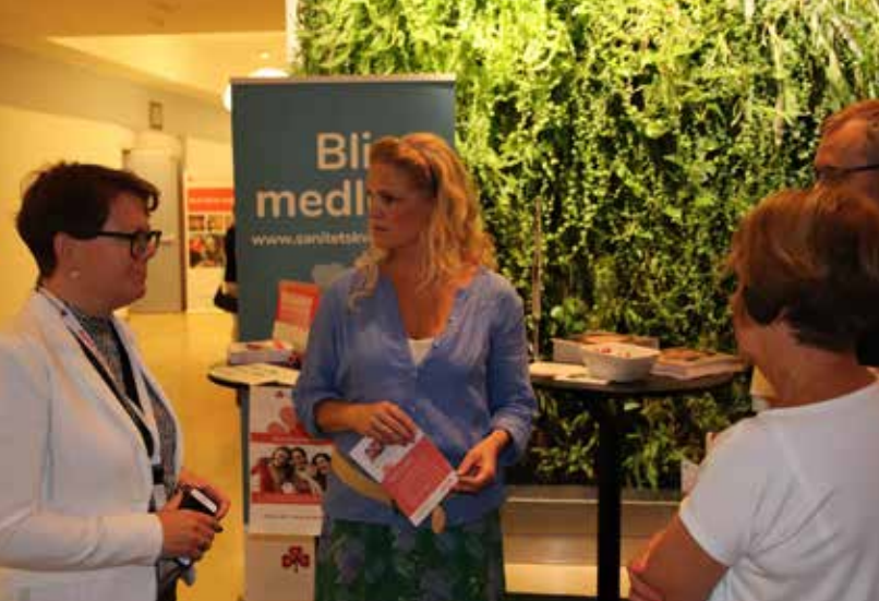
Beredskapsminister Ingvil Smines Tybring-Gjedde viste stor interesse for Sanitetskvinnenes arbeid da hun var en av flere foredragsholdere på Fellessamlingen på Fornebu.