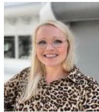
HELENE Ansv. Medl.service Medlemskontakt Epost/telefon System/CRM: Drift, effektivisering og utvikling Analyse og rapportering Dokumentasjon