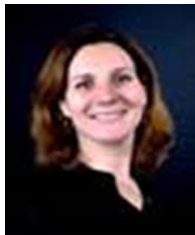
MAGALIE Rådgiver medl og kampanjer Medlemsrekruttering Medlemspleie/CRM Fastelavn Maiblomsten Sanitetens uke Julekampanje