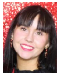
KAROLINE Rådgiver medl service Medlemskontakt Epost/telefon Rapportering Dokumentasjon