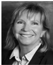
CHRISTINA Sr rådgiver n.liv og marked Inntekter næringsliv Innsamling Varemerke og profil