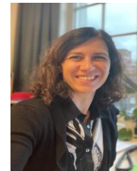
LENA Web redaktør Tekstarbeid Redigering Analyse & innsikt Innh produksjon Teknisk drift Teknisk utvikling Nettbutikk