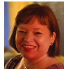
LINE Komms rådgiver Mediesaker Pressemeldinger Kronikker Nettsaker Digitale historier