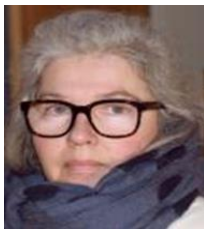
BEATE Komms rådgiver Fredrikke Årsmeldingen Nettsaker Taler & manus Komitéarbeid