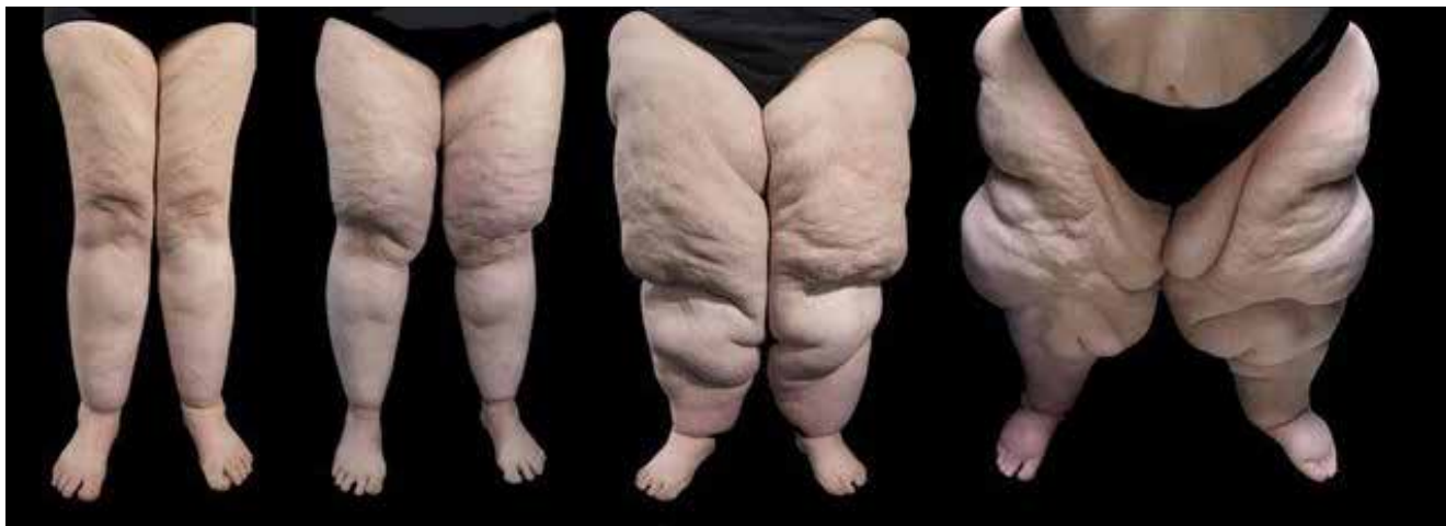
Lipødem har flere forskjellige tilstander.