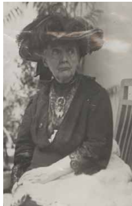
Er det noen som fortjener en egen dag, er det nettopp Fredrikke Marie Qvam. Korridorenes dronning, og en av Norges mest betydningsfulle kvinner gjennom tidene.