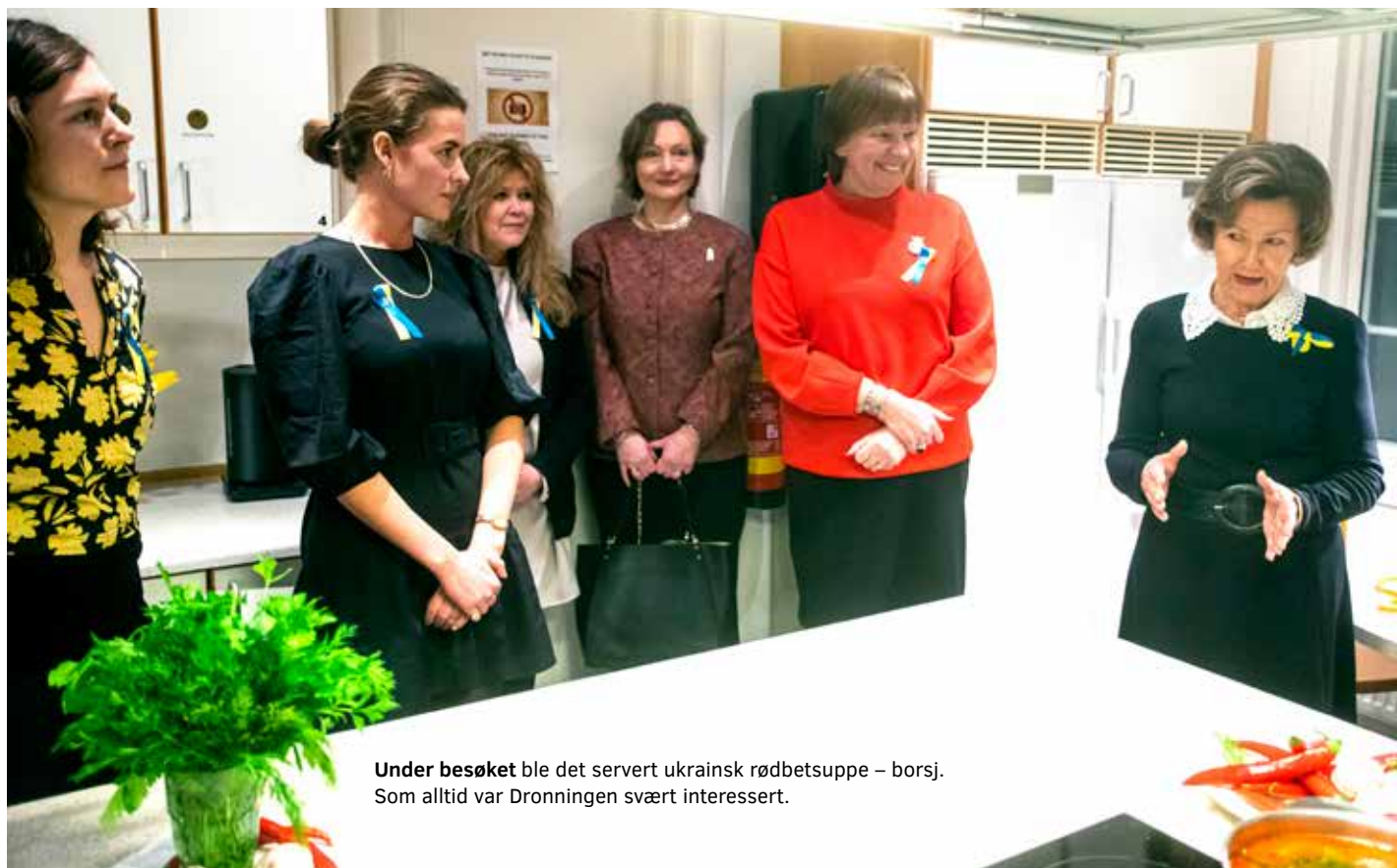
Under besøket ble det servert ukrainsk rødbetsuppe – borsj. Som alltid var Dronningen svært interessert.

Her får publikum et innblikk i stolte håndverkstradisjoner gjennom et utvalg gjenstander fra De kongelige samlinger, og noen helt spesielle innlån.