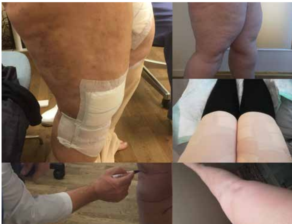
Mange norske kvinner reiser til Sverige for å få behandling, og må dekke den av egen lommebok.