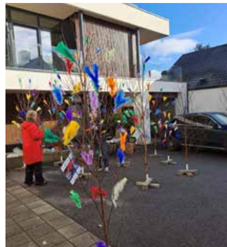
I Sandnes ble også fastelavnstrær solgt for å klare målet om salg av fastelavnsris for 200 000 kroner.