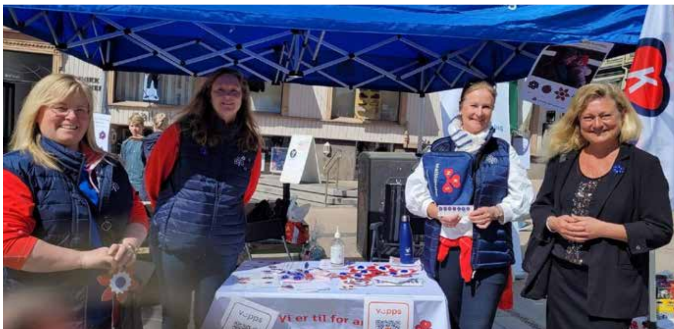
Inntektsgivende arbeid har alltid vært viktig for å sikre foreningens arbeid i lokalemiljøet. Maiblomsten har blitt solgt siden 1909.

Forskning på kvinnehelse er et veldig viktig område, og det å bidra til den fellesdugnaden som Sanitetskvinner viste under koronapandemien, og andre