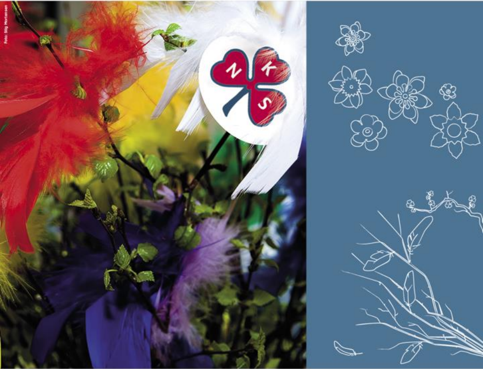
Fastelavnsris og maiblomster

Sanitetskvinnene har tradisjonelt vært dyktige til å finne ulike måter å finansiere sitt arbeid på. Salg av maiblomster, julemerker og fastelavnsris har vært viktige inntektskilder i tillegg til basarer og loddsalg.