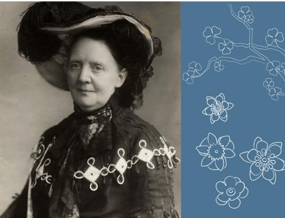
Fredrikke Marie Qvam

Sanitetskvinnenes grunnlegger, Fredrikke Marie Qvam, var en av den norske kvinnebevegelsens fremste ledere fra 1890-årene frem til sin død i 1938. Hun kalles «korridorenes dronning» på grunn av sin fremragende evne til å påvirke politikere og kjempe for kvinners rettigheter, i en tid der kvinner ikke hadde stemmerett.