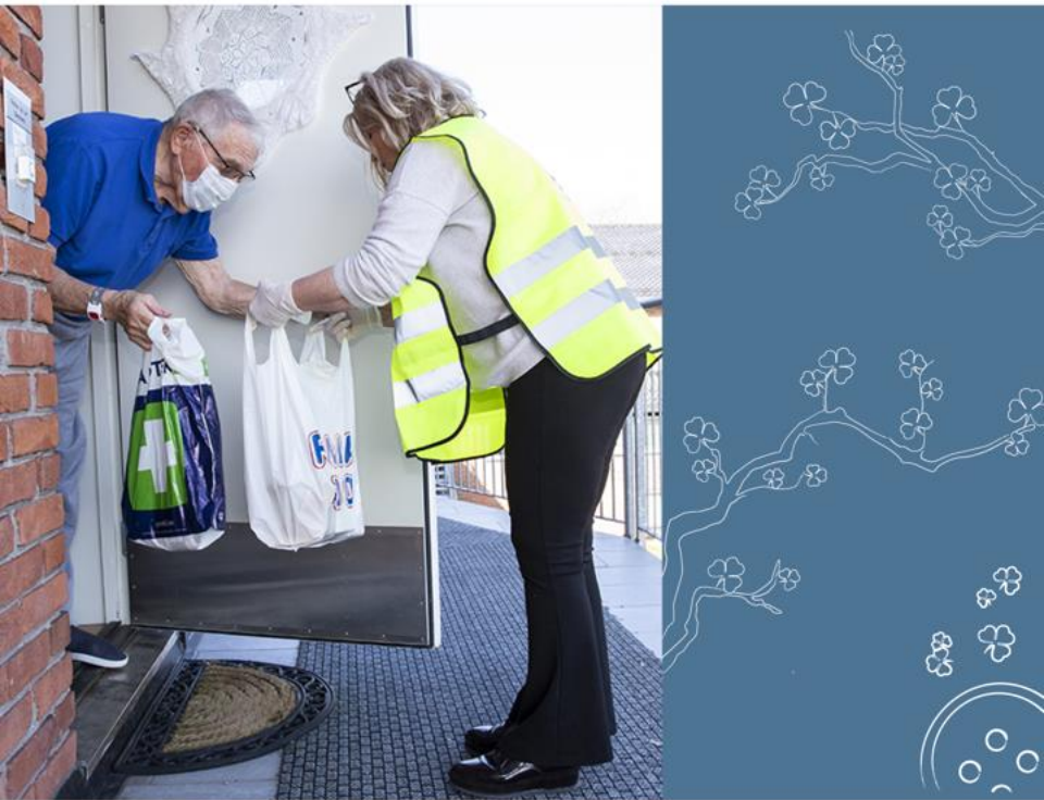
Omsorg i kriser

Sanitetskvinnene har helt siden starten vært en beredskapsaktør. Det begynte med kampen mot tuberkulosen, og etter hvert utviklet organisasjonen seg til å bli en støttespiller i kriser og ulykker. I koronadugnaden bisto de med hjelp til sårbare grupper, og la ned titusenvis av frivillige timer i forbindelse med koronavaksineringen.